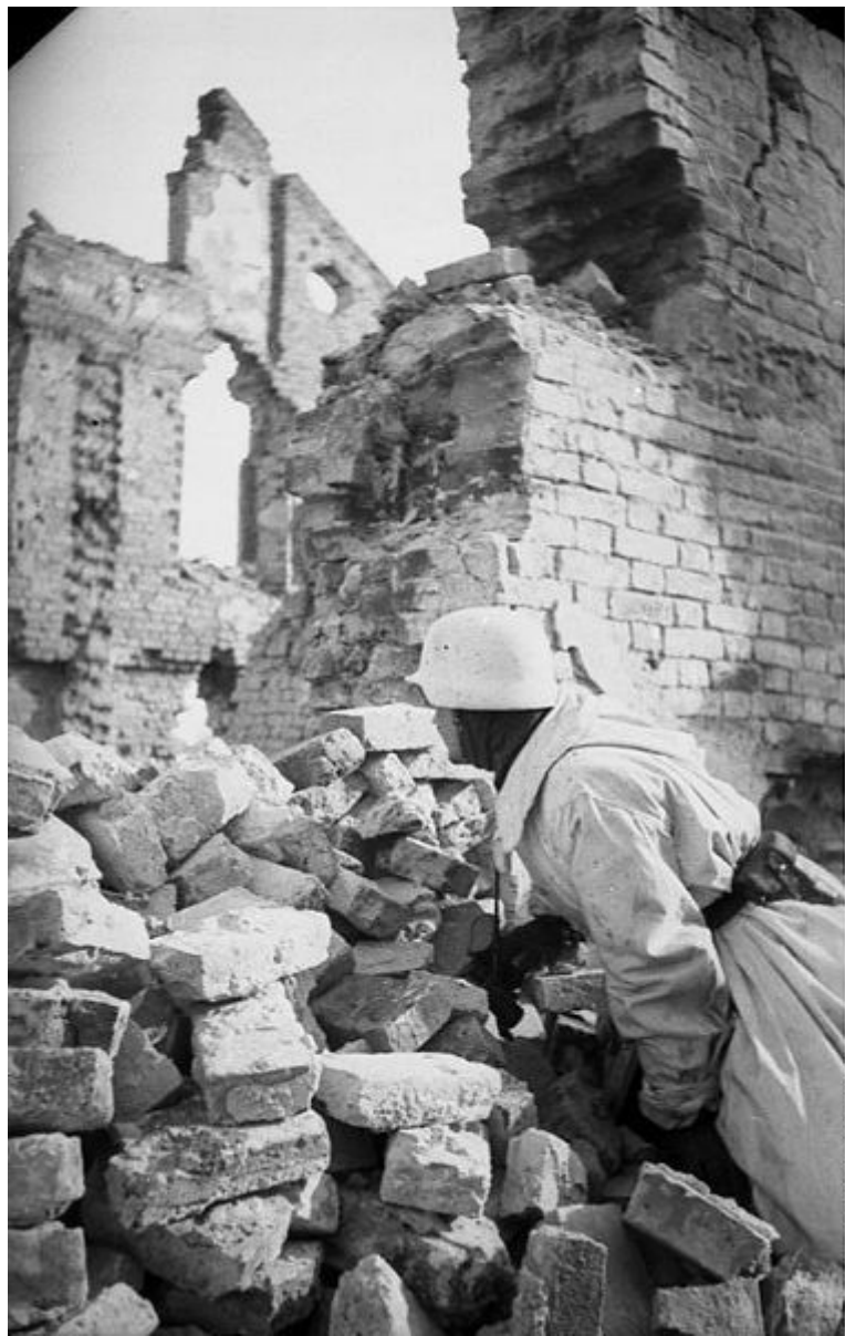
Sundcarothi, Sid 1011.004.2530.38A | 1942, Arhang