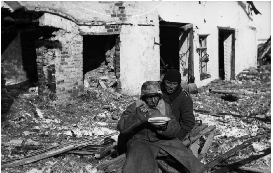
1942, Anfang