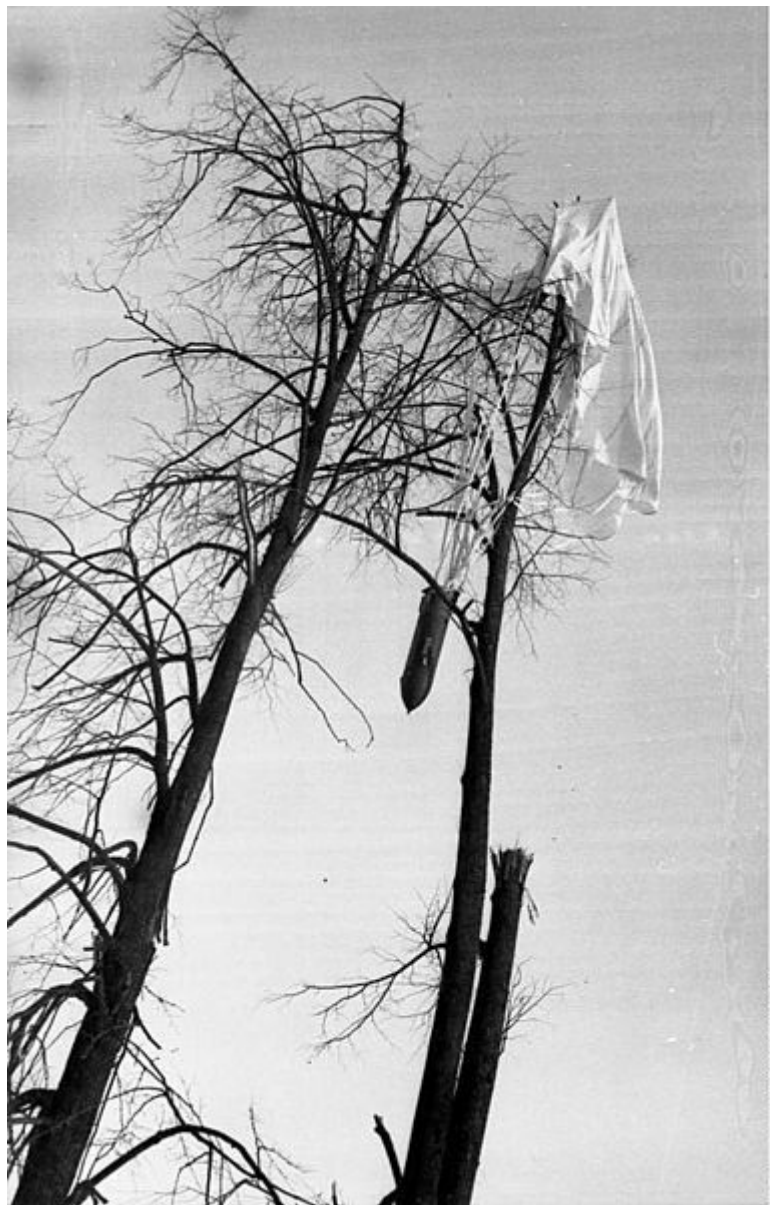
1942, Ahrang