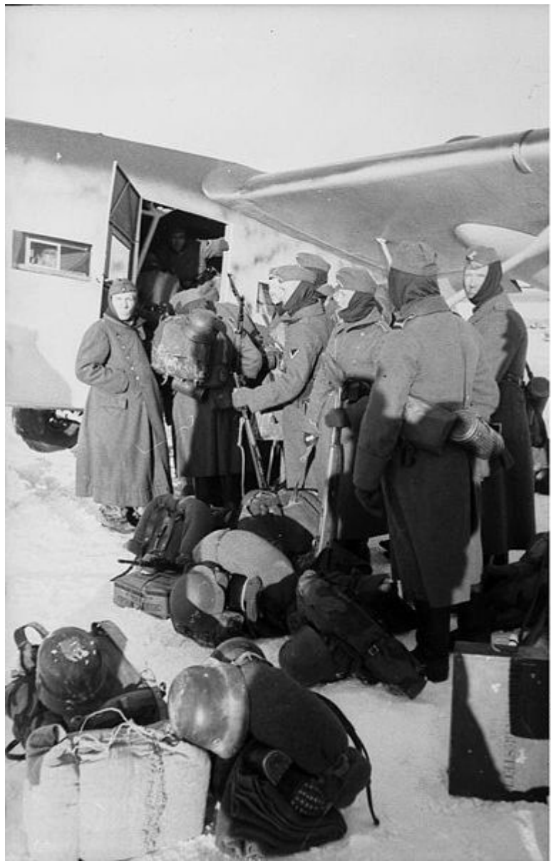
1942, Anfang