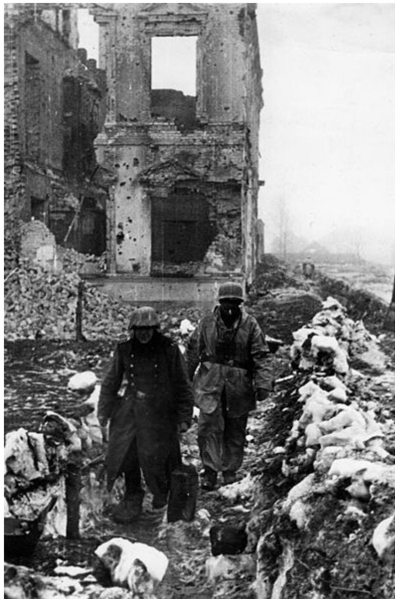
Судакорчи, Bild 183 871250, Pruhing