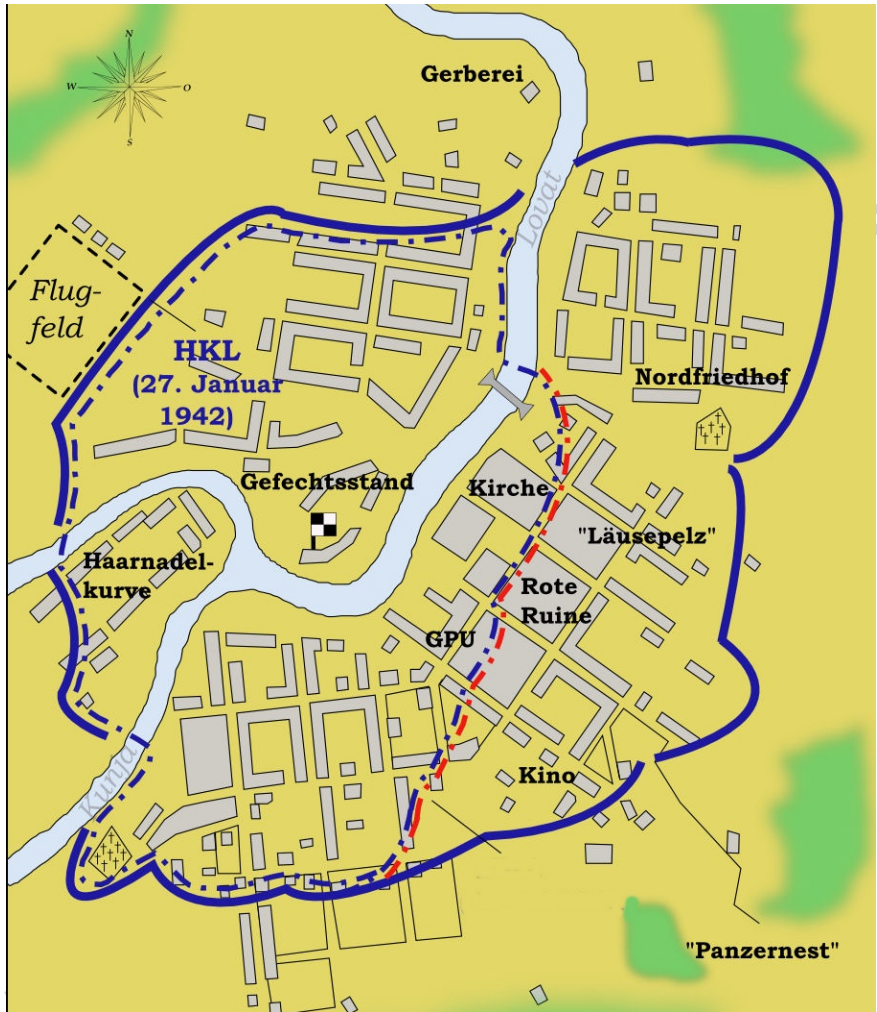
Die Schlacht um Cholm